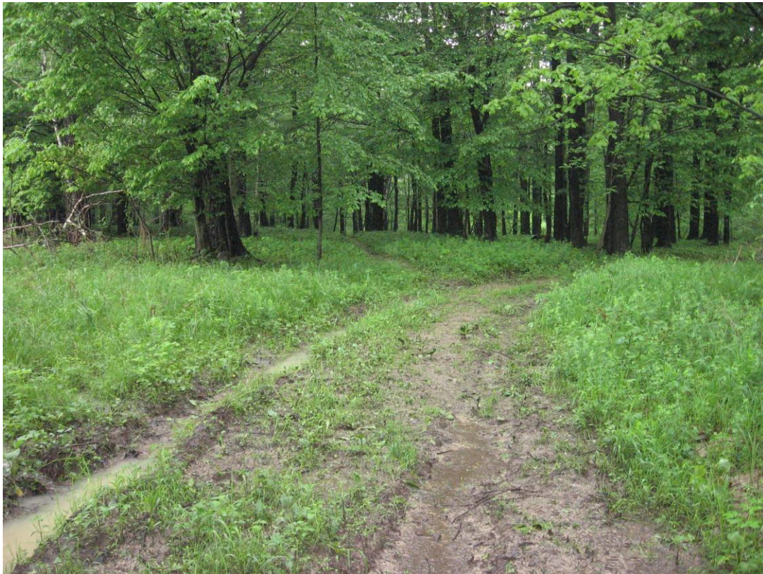
2. Přístupová cesta k prameni Sirkovica – nezpevněná lesní cesta v místě, kde uhýbá vpravo z kopce do lesa. K prameni vede nezřetelná pěšina doleva za mohutným habrem. Pěšinou je to od kraje lesa asi 100 m.