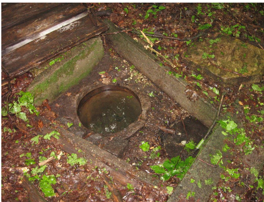
1. Pramen Sírkovica na západním okraji Brušperského lesa.

Podobný pramen, ovšem velmi malý a málo mineralizovaný, je v katastru města Brušperku, asi 1,5 km východně od náměstí na okraji lesního komplexu sahajícího až k Paskovu. Pramen Sírkovica je památkou na pradávnné síly, které kdysi vytvořily Karpaty.