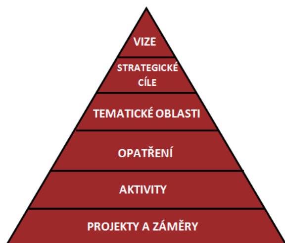
Obr. 1: Struktura strategického plánu pro orientaci v Akčním plánu

Jednotlivé úrovně jsou definovány ve Strategickém plánu rozvoje města následovně: