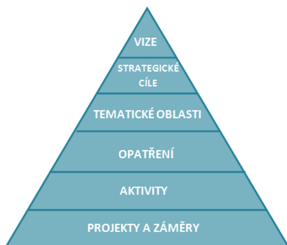
Obr. 1: Struktura strategického plánu pro orientaci v Akčním plánu

Jednotlivé úrovně jsou definovány ve Strategickém plánu rozvoje města následovně: