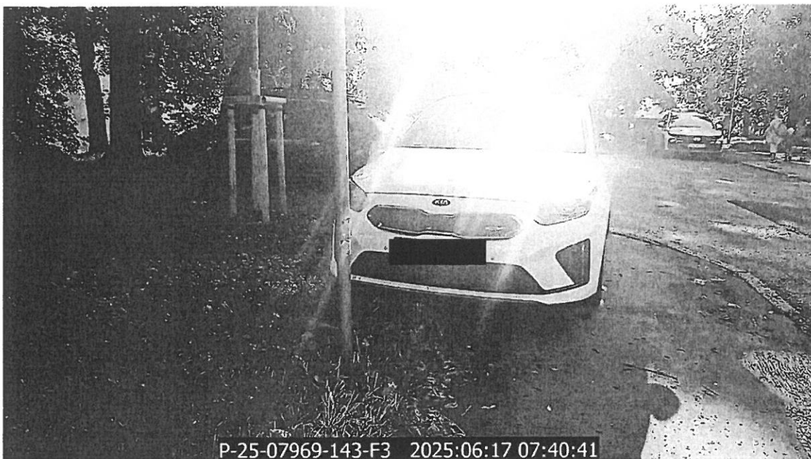
P-25-07969-143-F3 2025:06:17 07:40:41